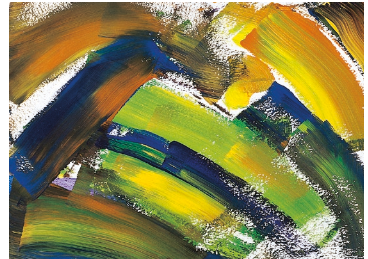
„Der zerbrochene Regenbogen“ (Mädchen 14 Jahre)

Vielleicht muss von allen Beteiligten auch entschieden werden, ob lebensverlängernde Maßnahmen (nicht) eingeleitet oder abgebrochen werden sollen. Ärzte und Pflegepersonal haben die schwierige Aufgabe, die richtigen Worte für das Kind und seine Eltern zu finden und Konflikte mit den Angehörigen über die weiteren Behandlungsschritte möglichst zu vermeiden.