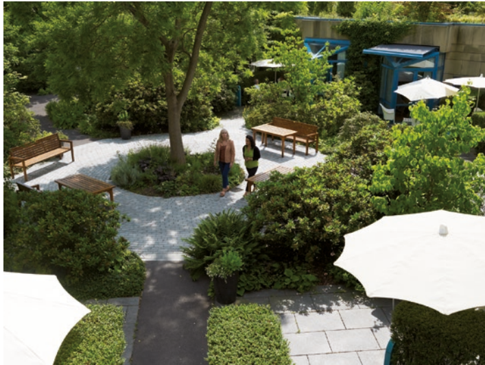
Blick in den Garten des Dr. Mildred Scheel Hauses