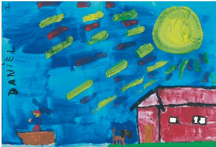
„Kleiner Mann geht mit dem Boot auf Reise“ (Junge 8 Jahre)

Schulkinder bis etwa neun Jahren zeigen ein eher sachliches Interesse am Tod und möchten oft gern mehr darüber erfahren. Sie wissen um die Endgültigkeit („ewiger Schlaf“) des Todes. Sie können Angst haben, verlassen zu werden, Angst vor dem Tod der Eltern. Bis zum zehnten Lebensjahr begreifen Kinder immer schneller und deutlicher, was Tod bedeutet.